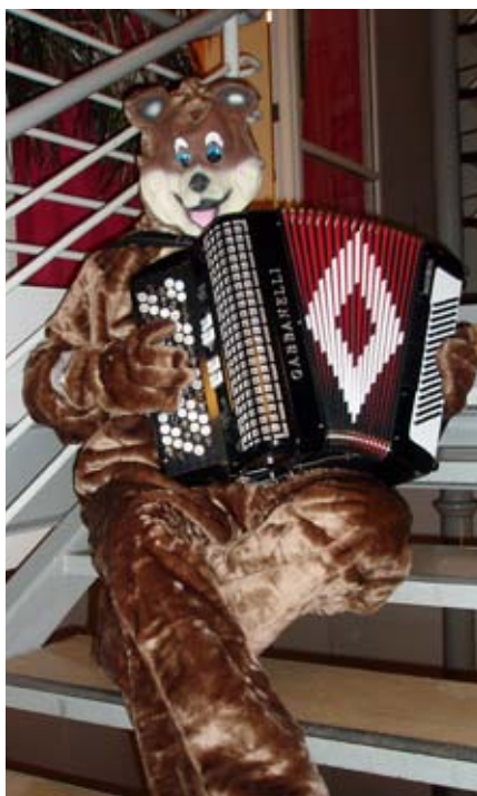
trekkspillbrumming: Både store og små bjørner i aksjon i "Tornado Animalski".