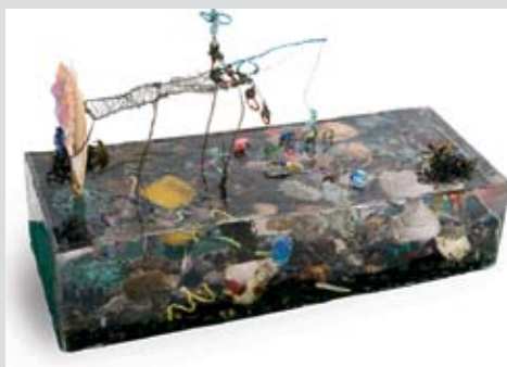
fra beiarn: "Rita på fisketur" av åttende klasse ved Moldjord og Trones skole.