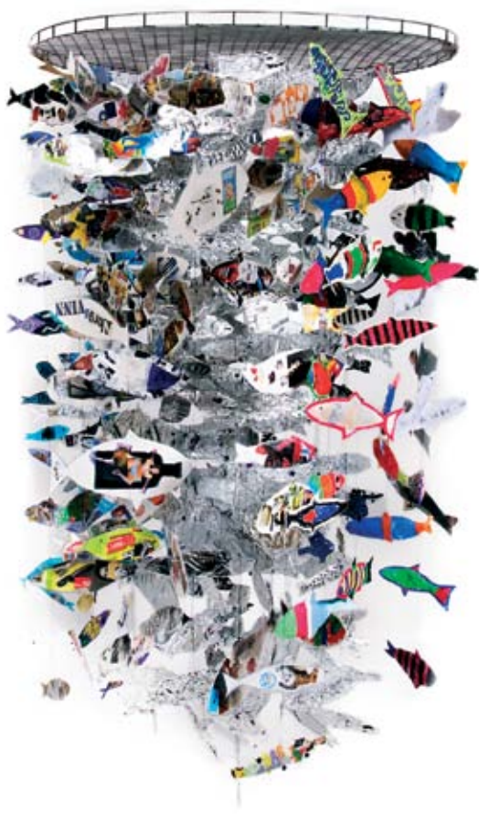
fra fauske: "Silda e kommen" av 250 barn fra sju ulike enheter i kommunen.