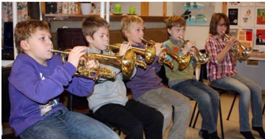
konsentrert blåserrekke: Elever ved Kvam skole fullt konsentrert om å treffe tonen.