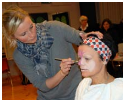
hverandres modeller: Kursdeltakerne skiftet på å være sminkør og modell.