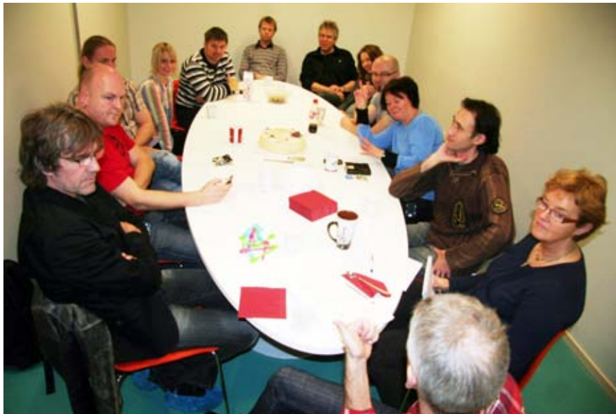
første møte: Sunndal kulturskoles stab samlet til sitt første møte i nye lokaler.

tekst: egil hofsl