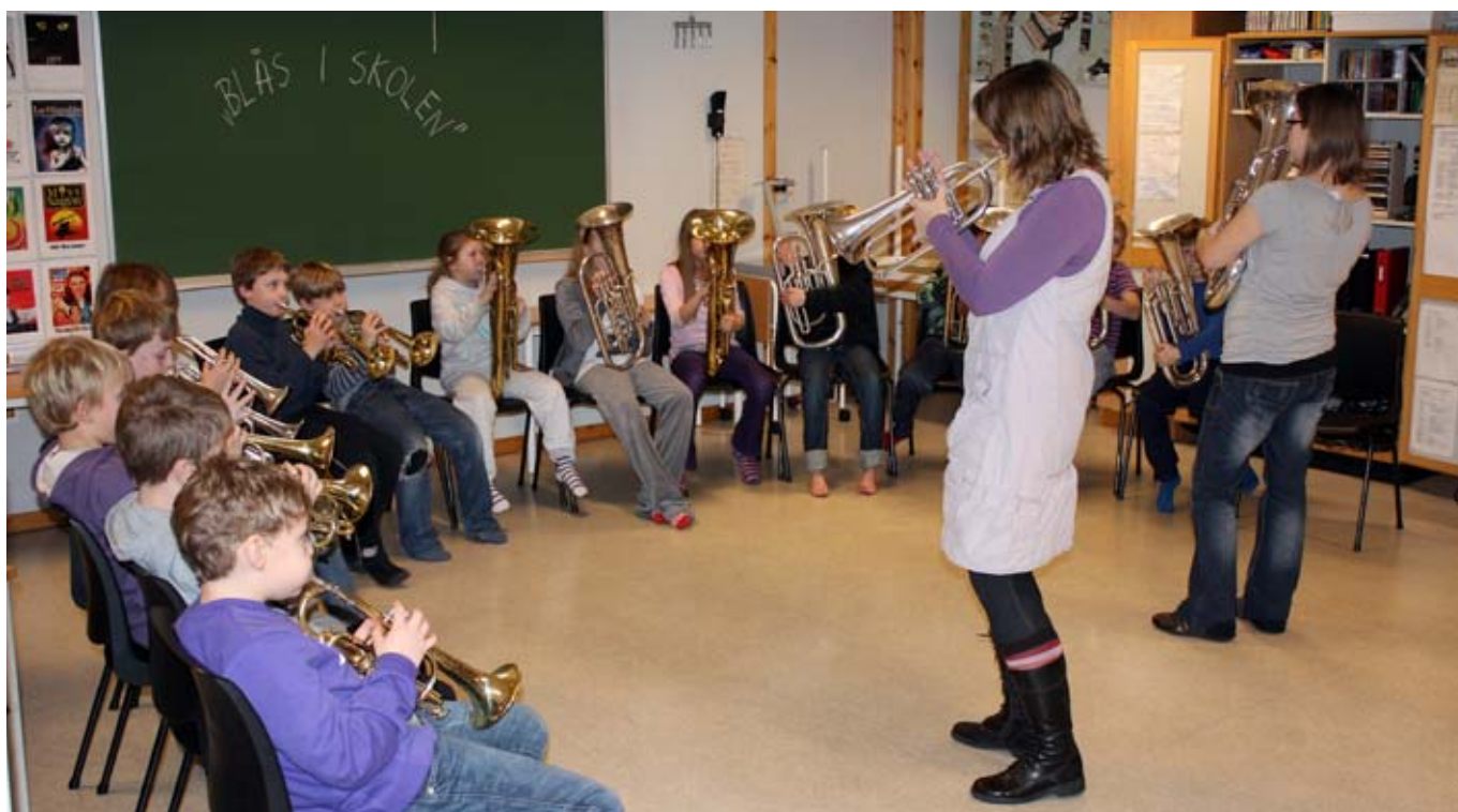
blåser i skoletimen: Grunnskoleelever, kulturskolelærere og instrument lånt fra skolekorps - en suksessoppskrift i Molde.