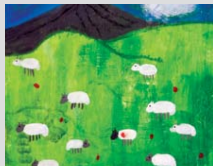
fra gildeskål: "På beite" av Thea Furuset Johansen, Gildeskål kulturskole.