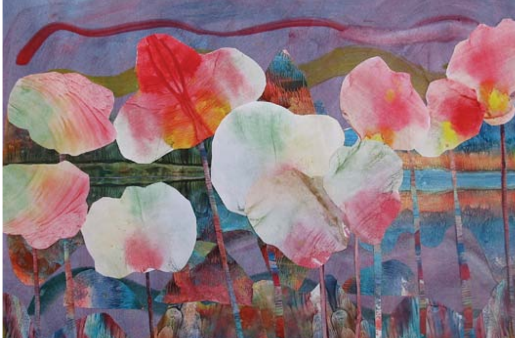
fra steigen: Kollasj av Kine Aalstad Jansen, Steigen kulturskole.

I alle kommunene var det profesjonelle kunstnere eller kunsthøgskolelærere som var veiledere. Hver kommune kunne velge ut hvilke arbeider som skulle delta på utstillingen. Noen valgte å delta med fellesarbeider, mens andre hadde individuelle arbeider. De innleverte arbeidene