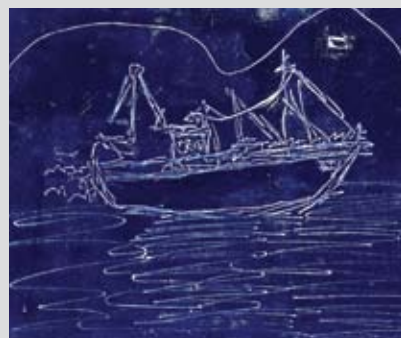
fra meløy: "Båt" av Sivert Brun Gjøviken, Meløy kulturskole.