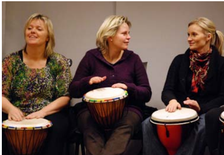
lekne rytmer: Kursdeltakerne fikk lære seg litt grunnleggende djembespill.