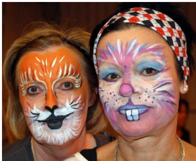
dyrisk: Innføring i fantasi- og dyresminke inngikk i sminke- og maskeringskurset.