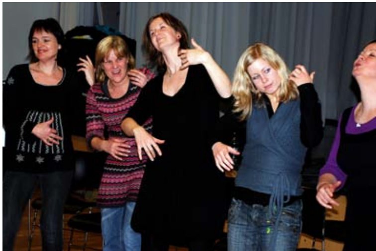
innlevelse: Luftkontrabass kan spilles med stor innlevelse.