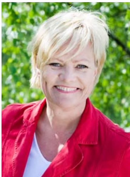
ministerforedrag: Kristin Halvorsen skal foredra om kulturoppføring på Kulturskolenes lederkonferanse i april.