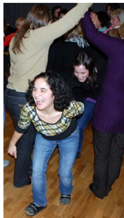
lang, lang lenke: Gjennom, under, rundt... Deltakerne fikk utfolde seg på golvet.