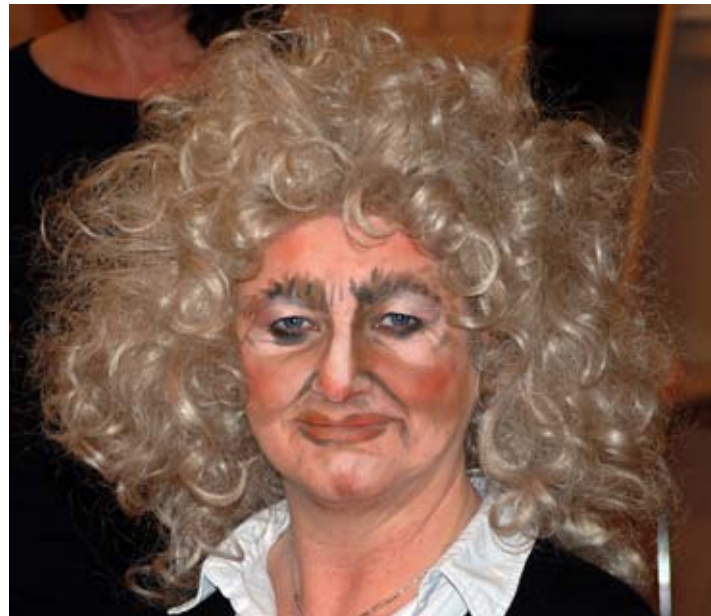
trollete åsyn: Og sånn så det ferdige trollet ut.